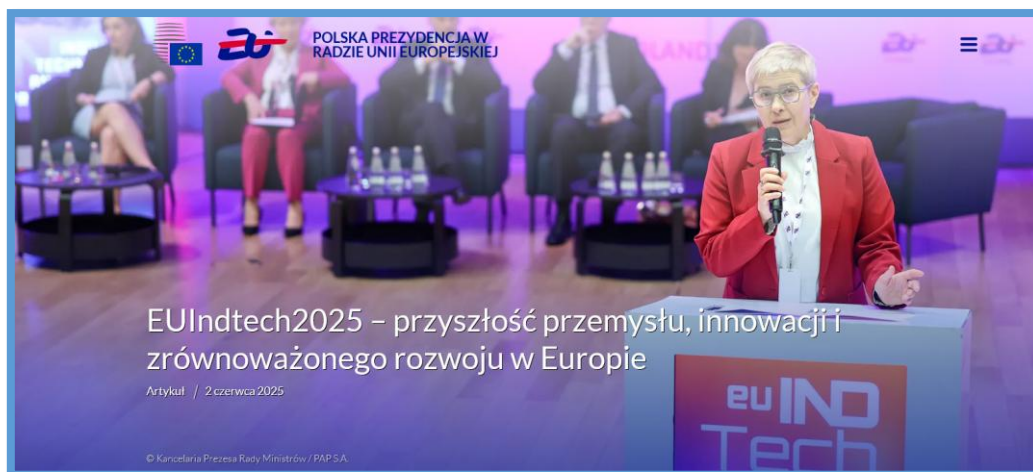
EUIndTech2025 – przyszłość przemysłu, innowacji i zrównoważonego rozwoju w Europie

https://polish-presidency.consilium.europa.eu/pl/wiadomosci/morze-baltyckie-w-erze-cyfrowej-miedzynarodowa-konferencja-na-rzecz-wspolnego-bezpieczenstwa-i-ochrony-infrastruktury-krytycznej/